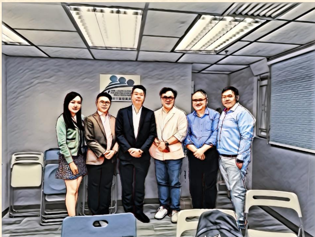
(某上市大型銀行高層在本會會址，商談開戶優惠計畫的現場繪圖。)

針對會員對銀行開戶服務的殷切需要，本會與某上市大型銀行高層商議，推出專為本會會員設立的銀行優惠開戶計畫。雙方已達成了基本共識，本會將以試點的形式逐步向會員推廣。